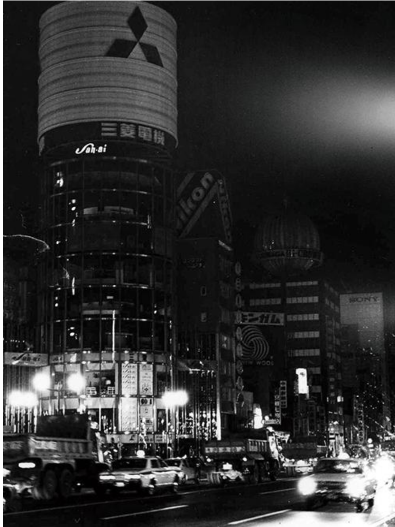
節電での広告ネオンを消灯する銀座